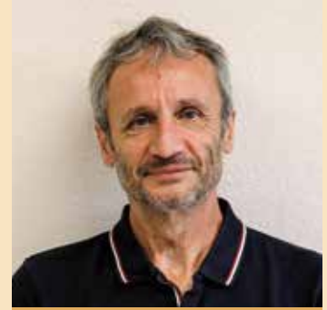
Par Alain GIBAUD Conseiller municipal délégué à la Valorisation du Patrimoine

D ès 1956, sous l'impulsion du Maire d'alors, Eugène Saumade, une réflexion est engagée à propos de la construction d'un Foyer Rural, et en 1960, avant même que le bâtiment sorte de terre, l'association "Foyer rural" est créée.