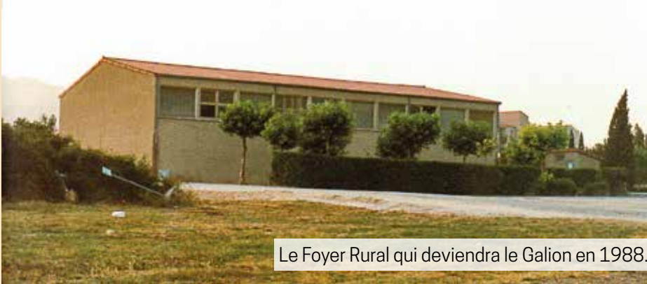
Le Foyer Rural qui deviendra le Galion en 1988.