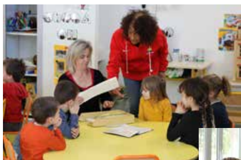
Mazet des Pitchouns

Les centres de loisirs enfants sont implantés dans des locaux spécifiques rattachés aux écoles, tandis que le Mazet Ados se situe dans le secteur de la Médiathèque Jean Arnal.