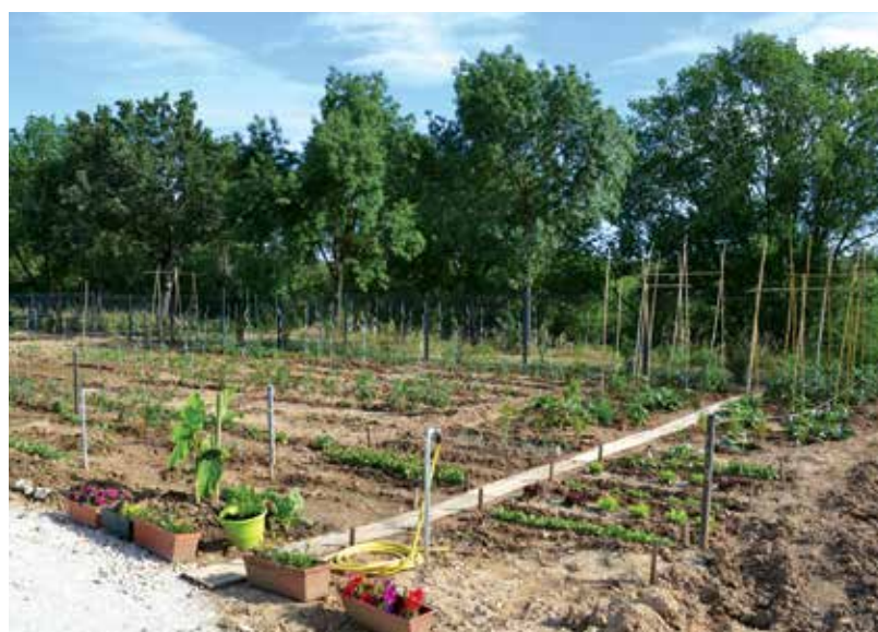
Les jardins familiaux - Chemin des Pinèdes

Quand les quinze jardiniers ont été retenus, ils se sont rassemblés et ont créé l' association « Les jardins du Terrieu » . Nous avons souhaité qu'ils puissent s'organiser librement. Un règlement intérieur , conçu en