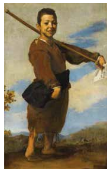
Jusepe de Ribera, Le Pied Bot, 1642 Paris, Musée du Louvre

En ce de mois de juillet, la Médiathèque proposera également de nombreuses animations aux enfants : des ateliers autour du jeu, sur la thématique du Maghreb (illustration, contes, musique, lecture, vidéo, multimédia, etc.).