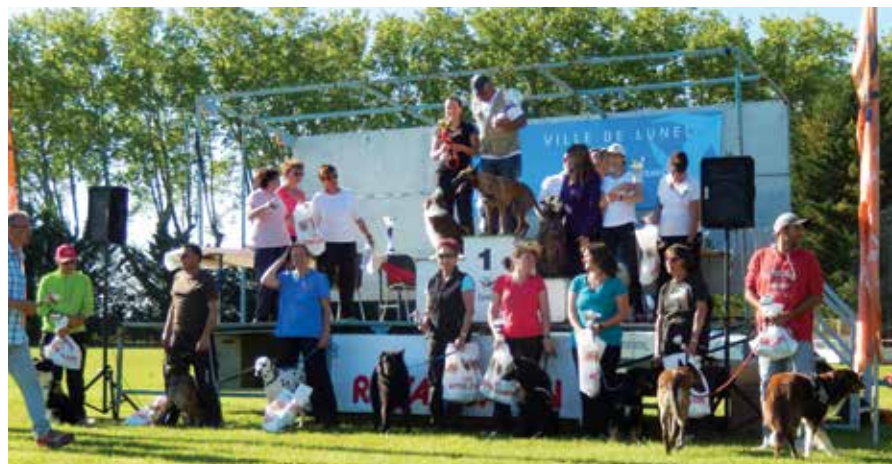
Podium du sélectif Grand Prix de France d'agility qui s'est déroulé à Lunel en mai dernier

Le travail de l'ACC du Pic St-Loup porte ses fruits. 4 équipes ont participé au Championnat de France d'agility (sport canin) à Annonay. 5 équipes sont sélectionnées pour participer au Grand Prix de France qui se déroulera les 5 & 6 juillet 2014 en Loire-Atlantique :