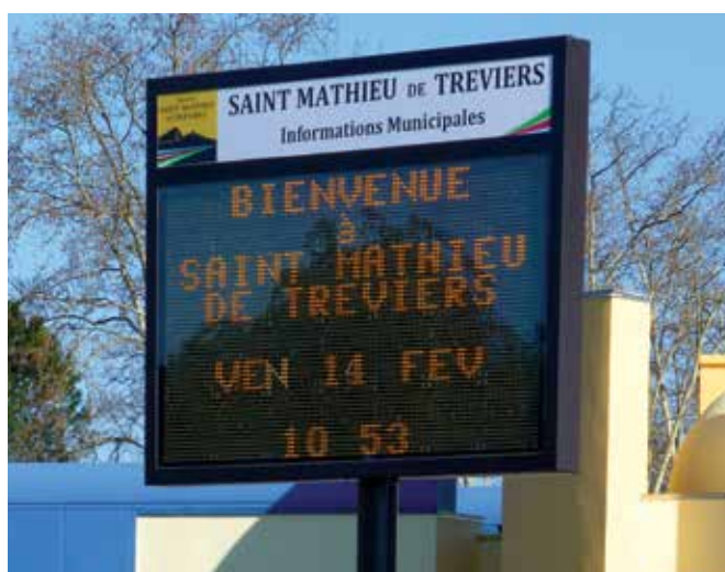
Entrée de ville - Rond-point de la Gendarmerie

Contactez la mairie à l'adresse suivante : accueil@villesmdt.fr