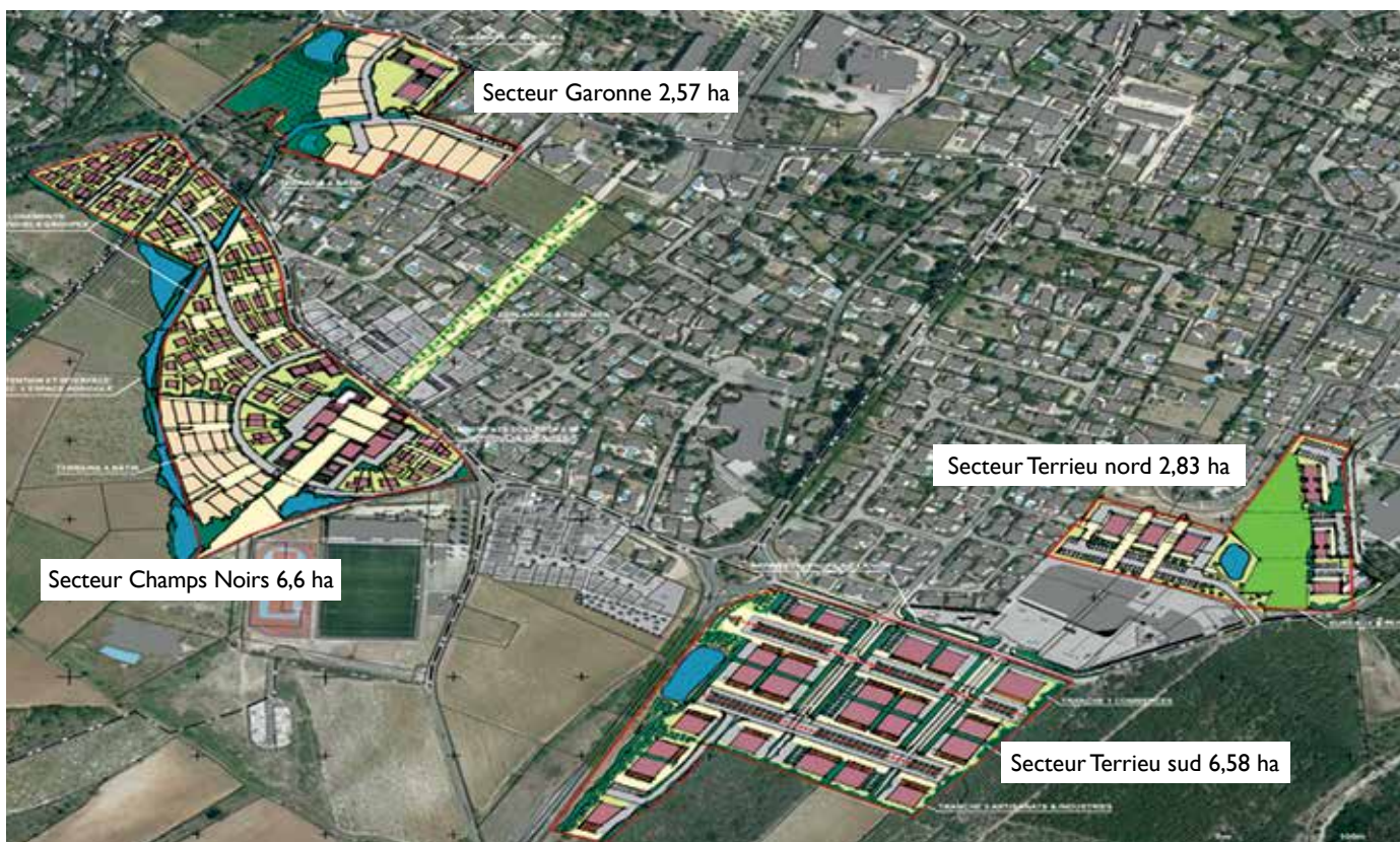
Le programme d'aménagement concerne 18,6 hectares dont 9,4 ha de zone d'activités

Le développement de l'activité économique est envisagé sur le secteur du Terrieu , de part et d'autre du supermarché. Il se ferait graduellement sur une période de 8 à 10 ans. Une attention particulière sera portée au paysage environnant afin de mettre en valeur l'entrée de ville .