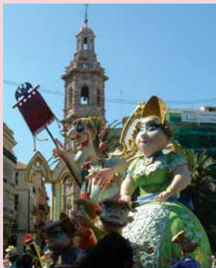
Les Fallas : Fête populaire valencienne